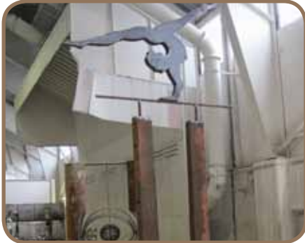
„TÄNZERIN, AUF DER OBERSTEN NOTENLINIE EINEN HANDSTAND MACHEND“